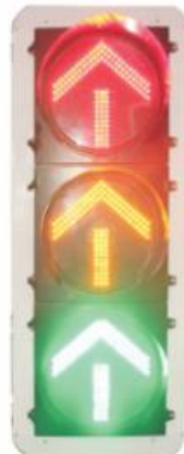
Arrow Traffic Light