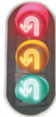
U-turn Traffic Lights

ไฟให้สัญญาณชนิดต่างๆ ที่ใช้ร่วมกับ Smart Traffic Light