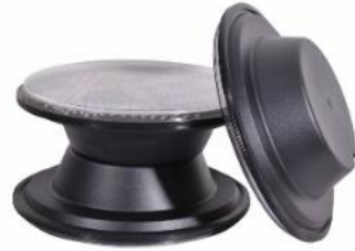
Traffic Light Modul