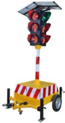
Solar Mobile Traffic Light