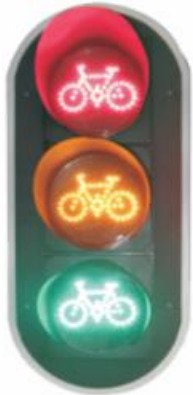
Bicycle Traffic Light