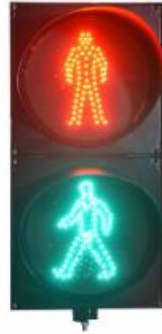
Pedestrian Traffic Light