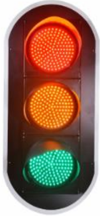
Ball Traffic Light